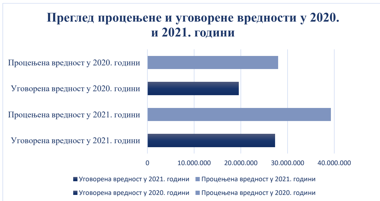
Графикон број 2: Преглед уговорене вредности исте врсте услуга набављених у поступцима јавних набавки у 2020. и 2021. години